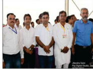
कार्यक्रम में सेवाएं देने वाले युवा स्वयं सेवक कार्यकर्ता एवं लाईव टीवी प्रसारण टीम