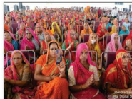
कथा का श्रवण करती समाज की मातृ शक्ति