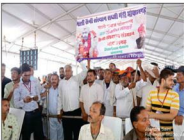
भोपालगढ़ माली समाज से पधारें समाजबंधु