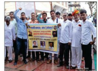
बाप माली समाज से पधारें समाजबंधु