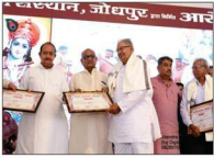
भामाशाह भूमिदान दाता गहलोत परिवार