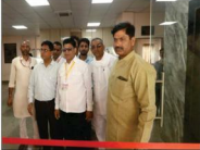
आरोग्य धवन का निरीक्षण करते पदाधिकारीगण एवं धवन का आकृषक स्वागत कक्ष