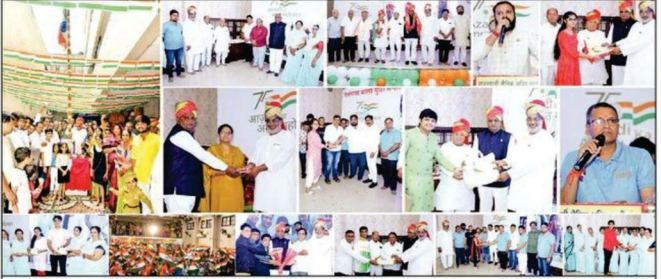
राजस्थानी सैनिक क्षत्रिय माली संघ द्वारा आयोजित अमृत महोत्सव कार्यक्रम का दृश्य।

हैदराबाद, 16 अगस्त। मिलाप ब्यरो राजस्थानी सैनिक क्षत्रिय माली संघ, वेगम बाजार के तत्वावधान में आज्ञादी का अमृत महोत्सव के अन्तर्गत विद्यार्थियों के लिए चैस, कैरम एवं इंडोर गेम्स प्रतियोगिताओं का आयोजन किया गया।