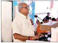
राज्यसभा सांसद राजेन्द्र गहलोत द्वारा संबोधन