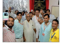
विभिन्न प्रदेशों से आए प्रबुद्धजनों द्वारा सेल्फी