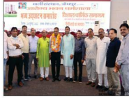
जयपुर से आए मेहमानों का बहुमान