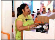
धौलपुर विधायिका शोभारानी कुशवाहा द्वारा संबोधन