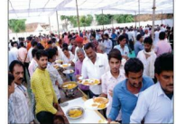
महाप्रसादी का आनंद लेते समाज बंधु