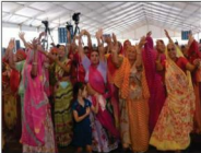
आरोग्य धवन में आयोजित नेनी बाई का मायरा में झूमते भक्त जन एव बाहरों से पधारें प्रबुद्धजनों का ढोल नगाड़ों पर नृत्य