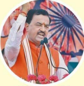
श्री केशव प्रसाद मौर्य