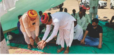
सैनिक क्षत्रिय माली समाज सामूहिक विवाह तैयारियां प्रारंभ