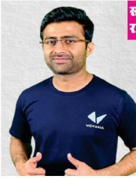
तरुण की टीम में 110 युवा शामिल हैं