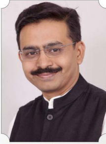
श्री राजीव सातव (राजससभा सांसद)