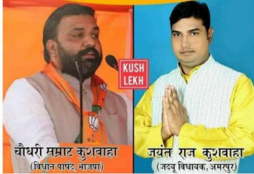
चौधरी सम्राट कुशावाहा (विधान पार्षद, भाजपा)