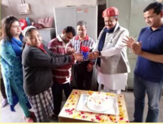
विमदित बच्चों के साथ