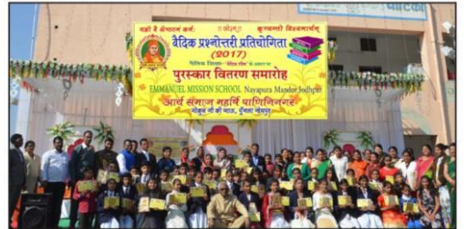
काली से संभवतः कर्तः श्री सुमेर उच्च माध्यमिक विद्यालय वैदिक प्रश्नोत्तरी प्रतियोगिता (2017) पुरस्कार वितरण समारोह EMMANUEL MISSION SCHOOL, Navagrah, Jodhpur आर्य समाज महर्षि पाणिनिनगर जोधपुर जी.बी.मार्ग, पूना संतान