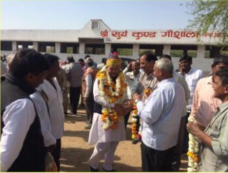
निम्बा निम्बड़ी गौशाला में शुभकमनाएं लेते हुए