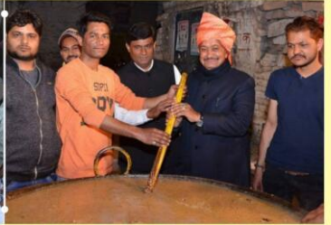
गौशाला में गायों के लिए लाप्सी में सहयोग