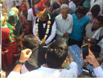
निःशुल्क चिकित्सा शिविर का आयोजन