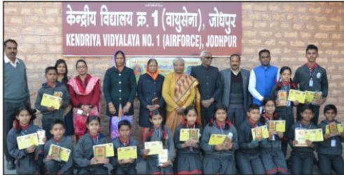
केन्द्रीय विद्यालय क्र. 1 (वायुसेना), जोधपुर KENDRIYA VIDYALAYA NO. 1 (AIRFORCE), JODHPUR