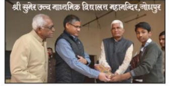
श्री सुमेर उच्च माध्यमिक विद्यालय महानन्दिर, जोधपुर

जोधपुर। आर्य समाज मंदिर, महर्षि पाणिनिगर के तत्वावधान में वैदिक प्रश्नोत्तरी प्रतियोगिता का पुरस्कार समारोह ईम्मानुइल मिशन विद्यालय व श्री सुमेर उच्च माध्यमिक विद्यालय, केन्द्रीय विद्यालय नं.1, किसान कन्या विद्यालय, रा.बा.उ.मा.पुजला, जे.बी.एम. स्कूल, चैनपुरा विद्यालय, माँ शारदा विद्यापिठ, पैराडाईज सैकण्डरी विद्यालय, भदवासिया विद्यालय, आर.एस.एम.विद्यालय, सुरसागर, कालीबेरी विद्यालय, सेन्ट ऑस्टिन स्कूल इत्यादि विद्यालयों में आयोजित कि गई।