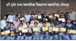
श्री सुमेर उच्च माध्यमिक विद्यालय महानन्दिर, जोधपुर