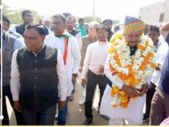
निवास स्थान पर सर्व समाज बंधुओं के साथ