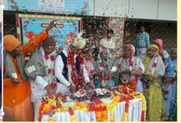
जोधणा वृद्धाश्रम में बुजुर्गों से आशीष लेते हुए