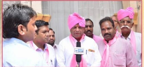
जयपुर में माली (सैनी) महासभा के आयोजन की झलकियां