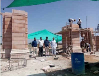
छात्रावास का भव्य गेट का निर्माण लगभग पूर्णतया की ओर