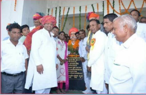
सवाई माधोपुर में महात्मा फूले की प्रतिमा का अनावरण करते अतिथिगण