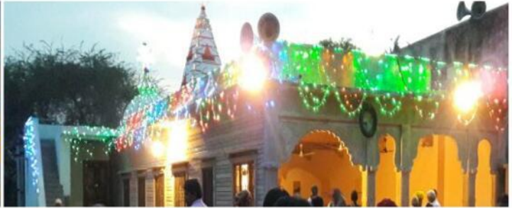
मेघड़दा(बर) में माली सैनी समाज के सावला जी महाराज के मन्दिर व मुर्ति प्राण प्रतिष्ठा में महिलाओं की कलश यात्रा एवं भवय मंदिर