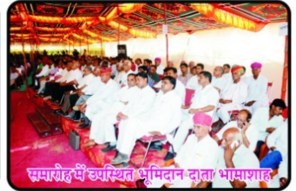
समारोह में उपस्थित भूमिदान दाता भामाशाह