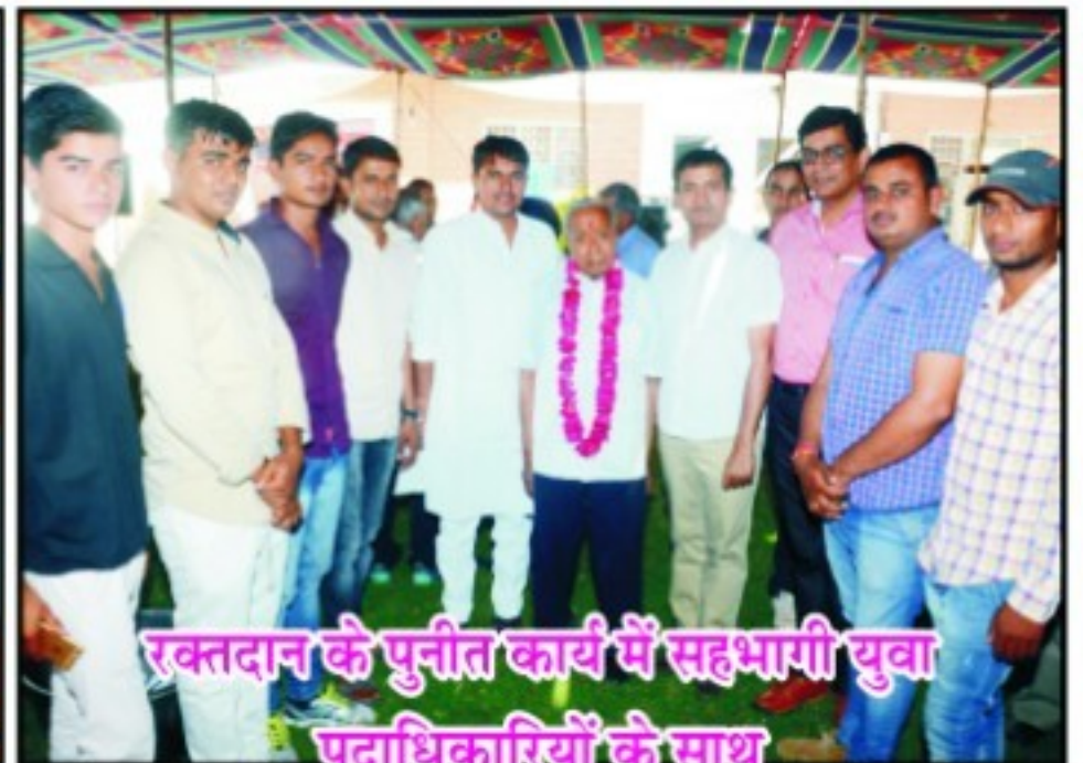
रक्तदान के पुनीत कार्य में सहभागी युवा पदाधिकारियों के साथ