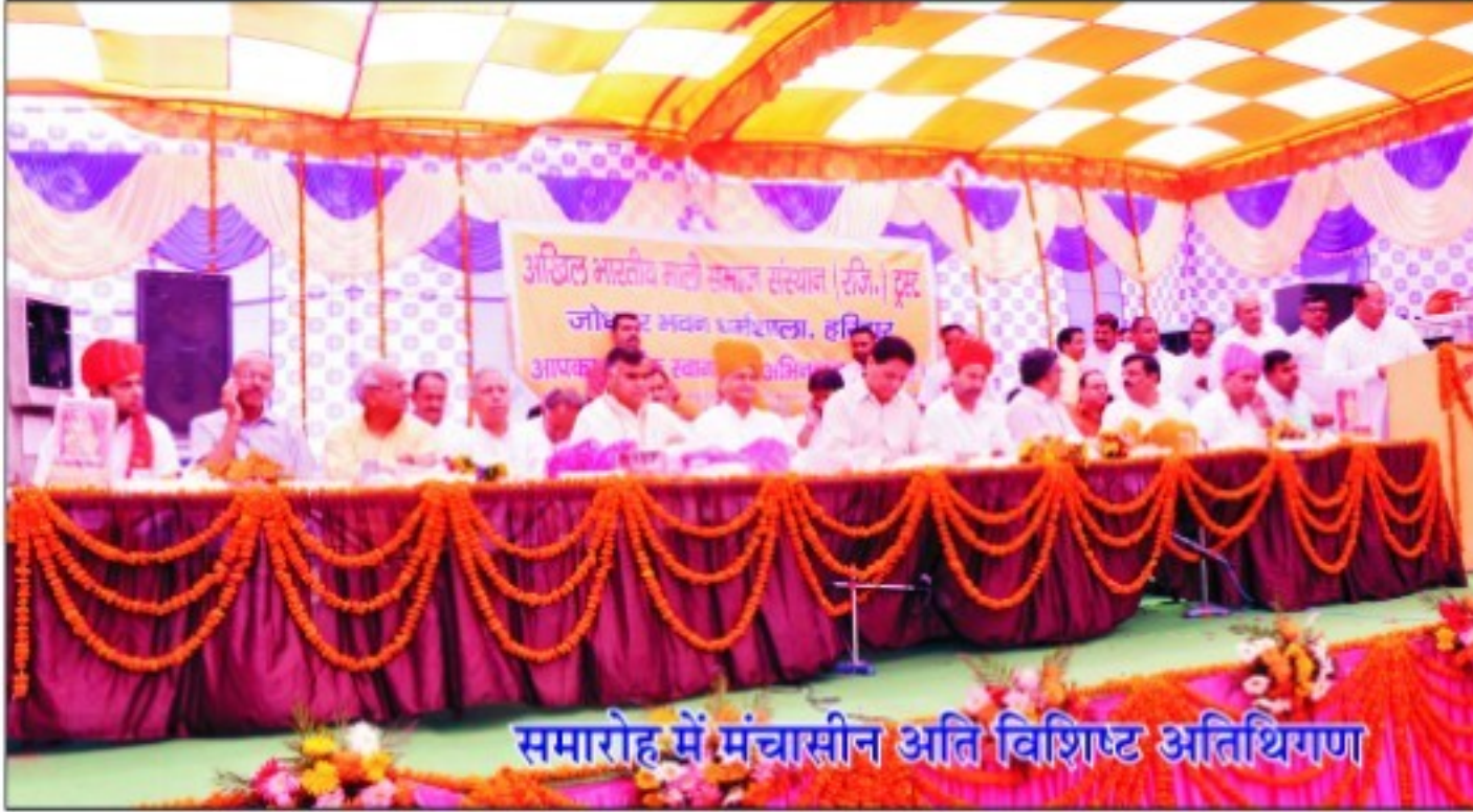
समारोह में मंचासीन अति विशिष्ट अतिथिगण