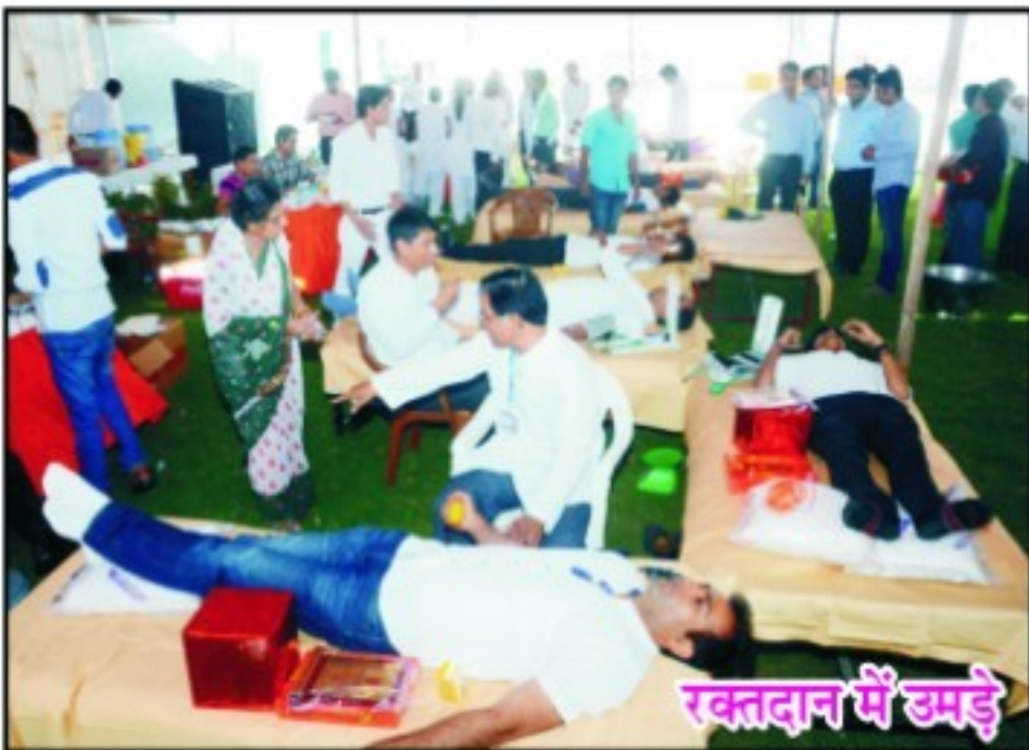
रक्तदान में उमड़े