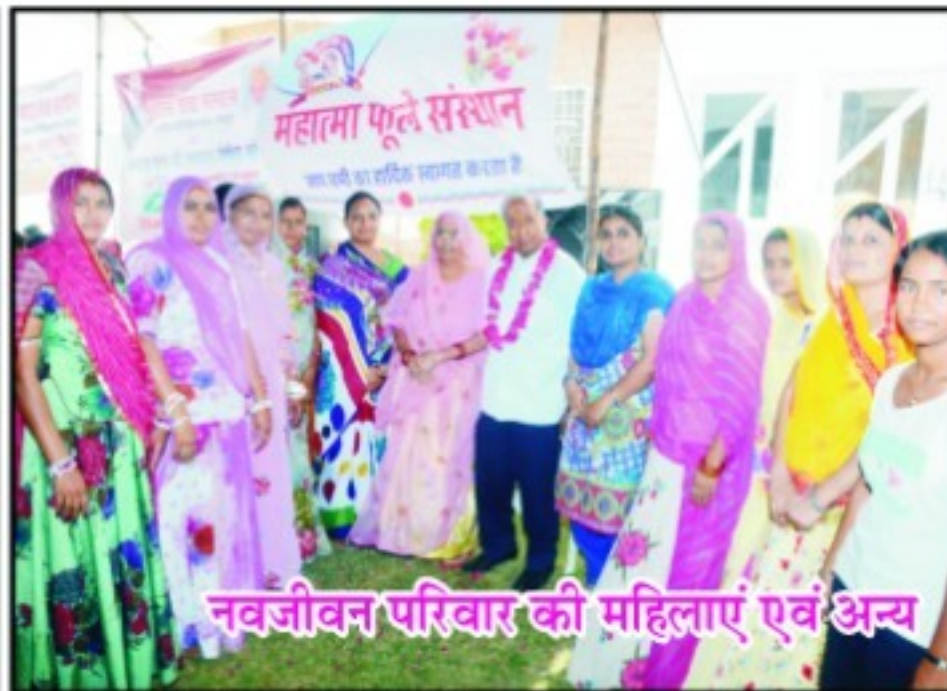
नवजीवन परिवार की महिलाएं एवं अन्य