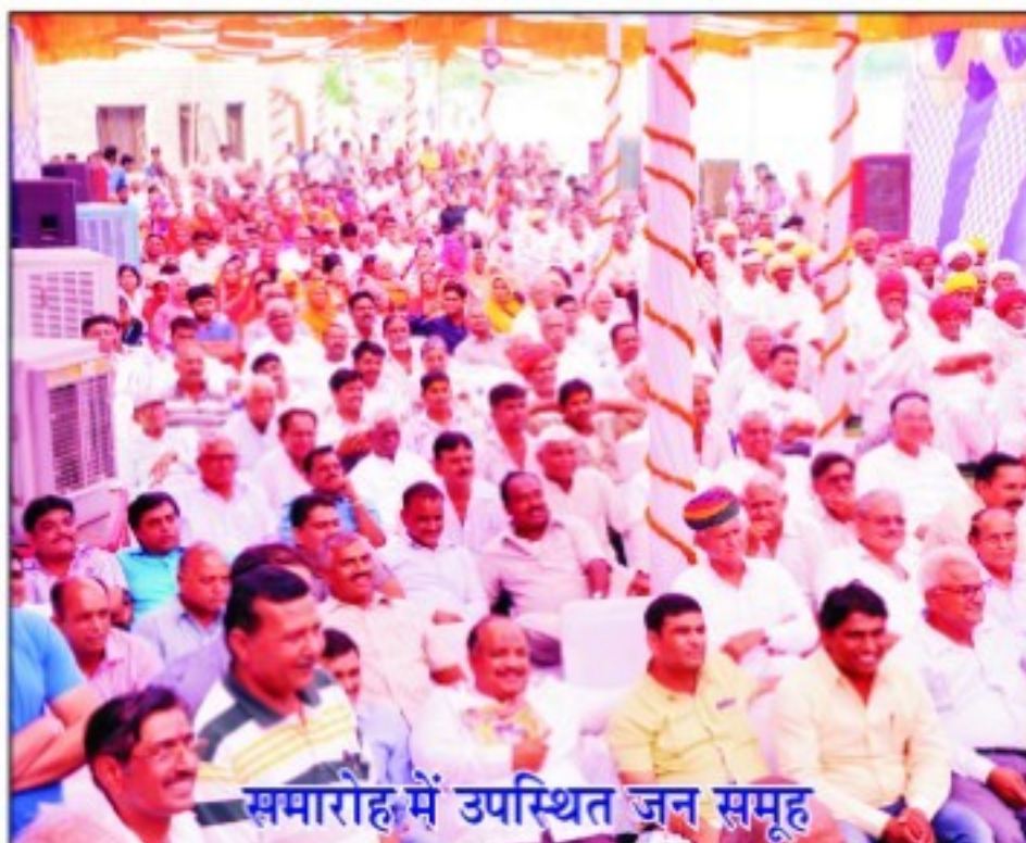
समारोह में उपस्थित जन समूह