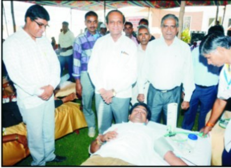
रक्तदान करते युवा