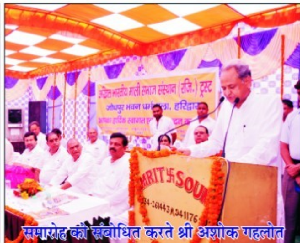
समारोह को संबोधित करते श्री अशोक गहलोत