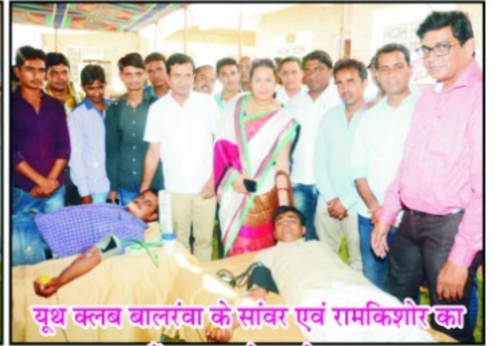
यूथ क्लब बालरवा के सांवर एवं रामकिशोर का हौसला बढ़ाते आयोजक