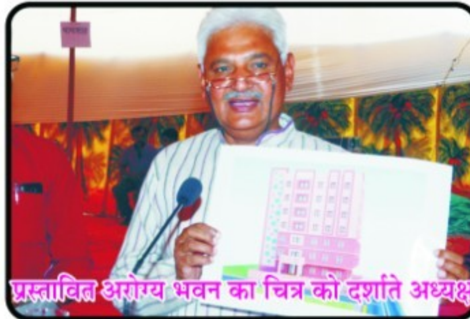
प्रस्तावित अरोग्य भवन का चित्र को दर्शाते अध्यक्ष