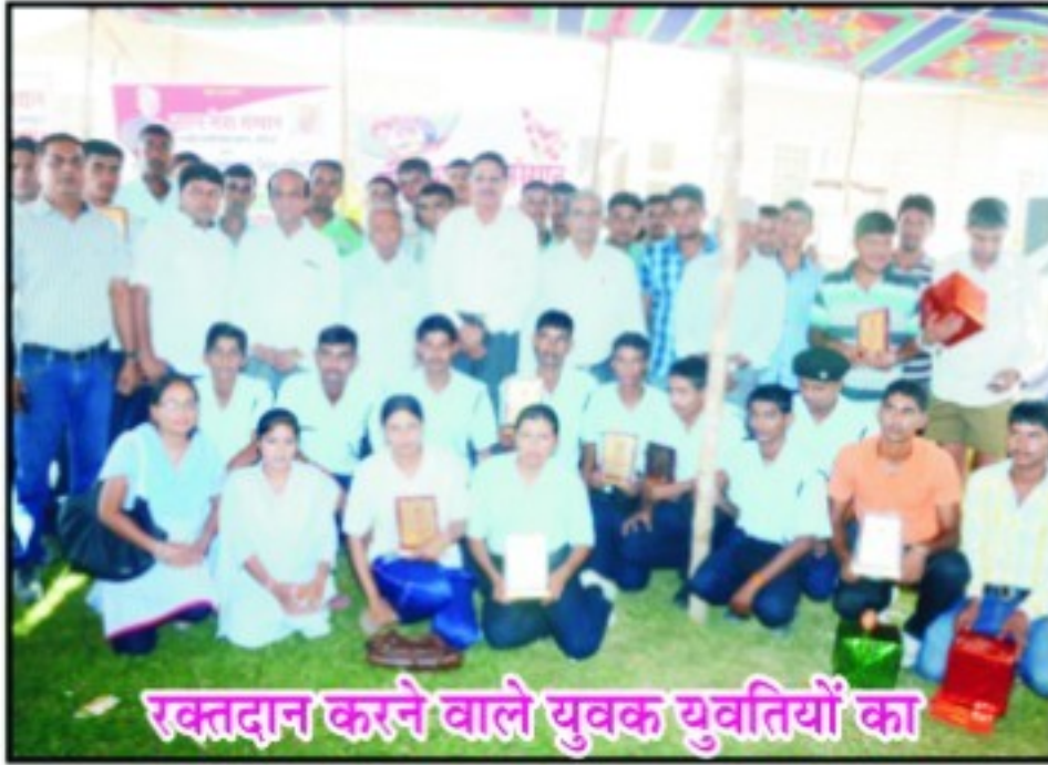
रक्तदान करने वाले युवक युवतियों का बहुमान करते गणमा-य अतिथिगण