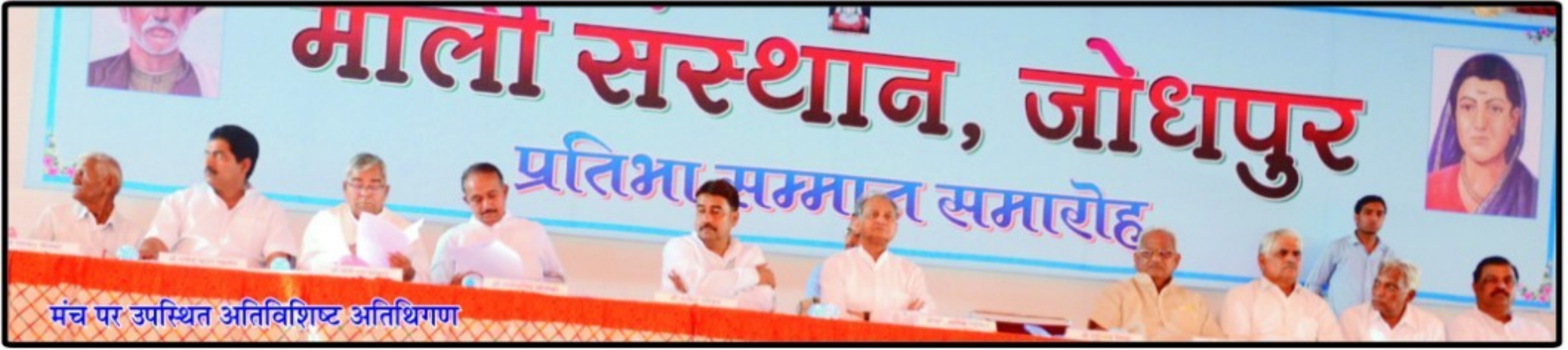
मंच पर उपस्थित अतिविशिष्ट अतिथिगण