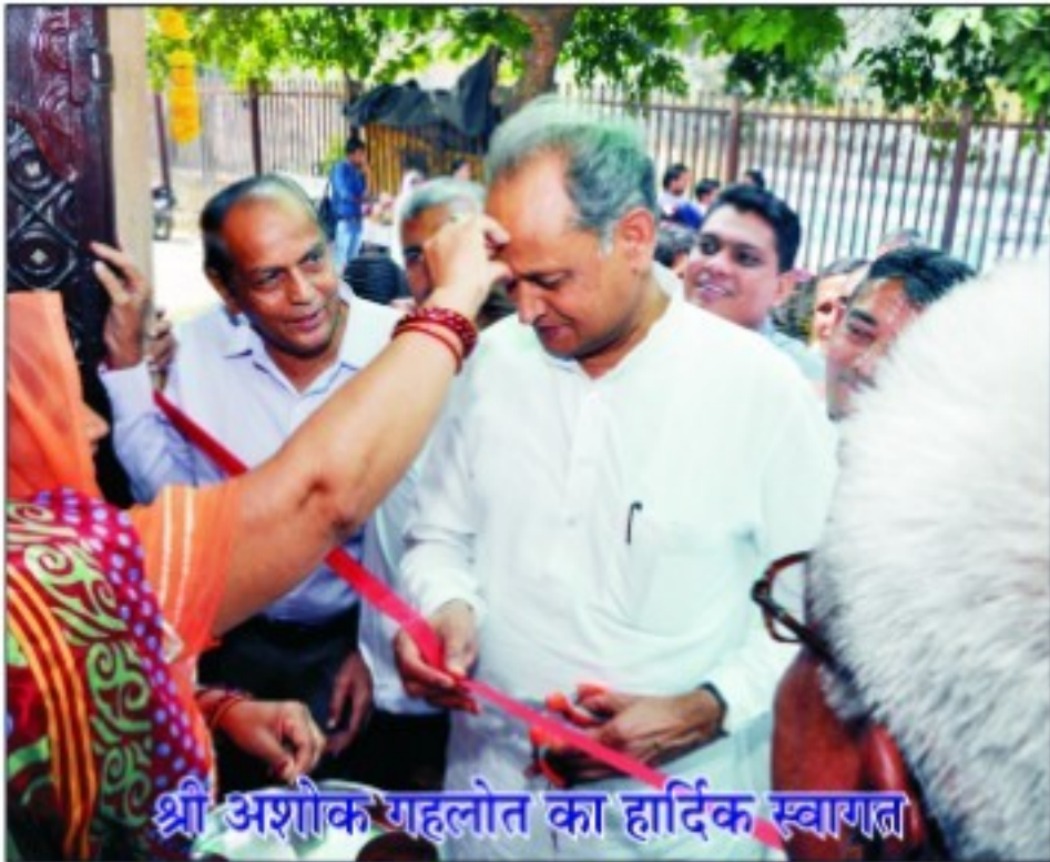
श्री अशोक गहलोत का हार्दिक स्वागत