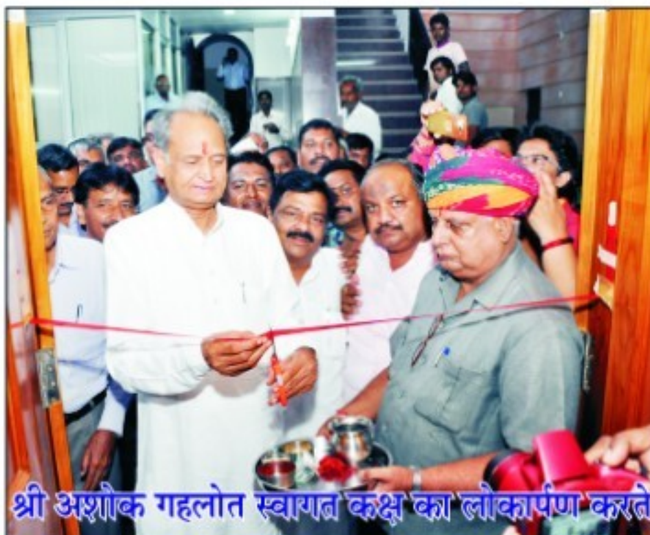
श्री अशोक गहलोत स्वागत कक्ष का लोकार्पण करते