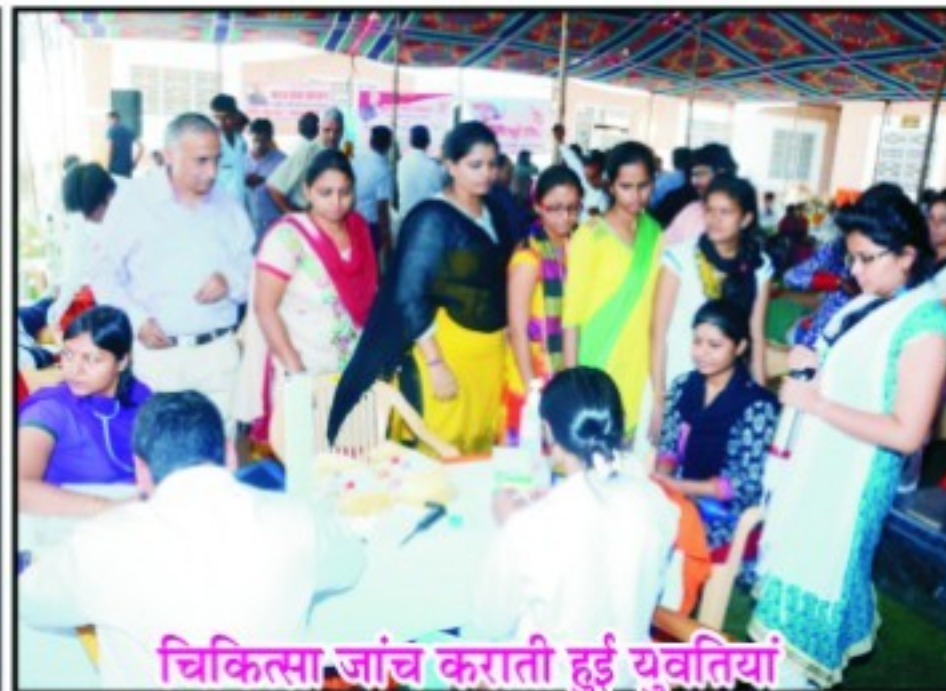
चिकित्सा जांच कराती हुई युवतियां