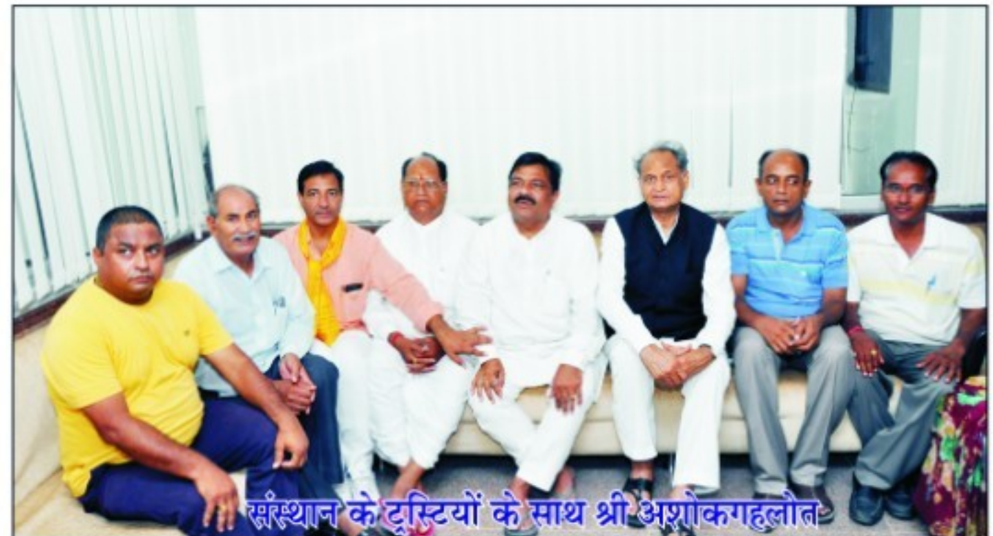
संस्थान के ट्रस्टियों के साथ श्री अशोक गहलोत