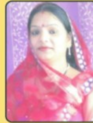
श्री बिना टाक पार्षद