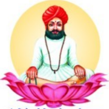
संत शिरोमणी लिखमीदास जी महाराज

माली समाज की प्रमुख पत्रिका के 10वर्ष पूर्ण कर 11वें वर्ष में प्रवेश करने पर हार्दिक बधाई एवं शुभकामनाएं