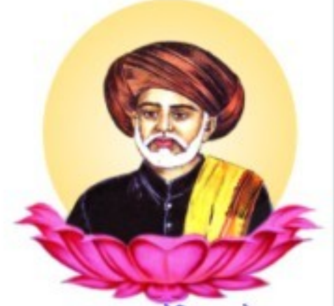
महात्मा ज्योति बा फूले

माली समाज की प्रमुख पत्रिका के 10वर्ष पूर्ण कर 11वें वर्ष में प्रवेश करने पर हार्दिक बधाई एवं शुभकामनाएं