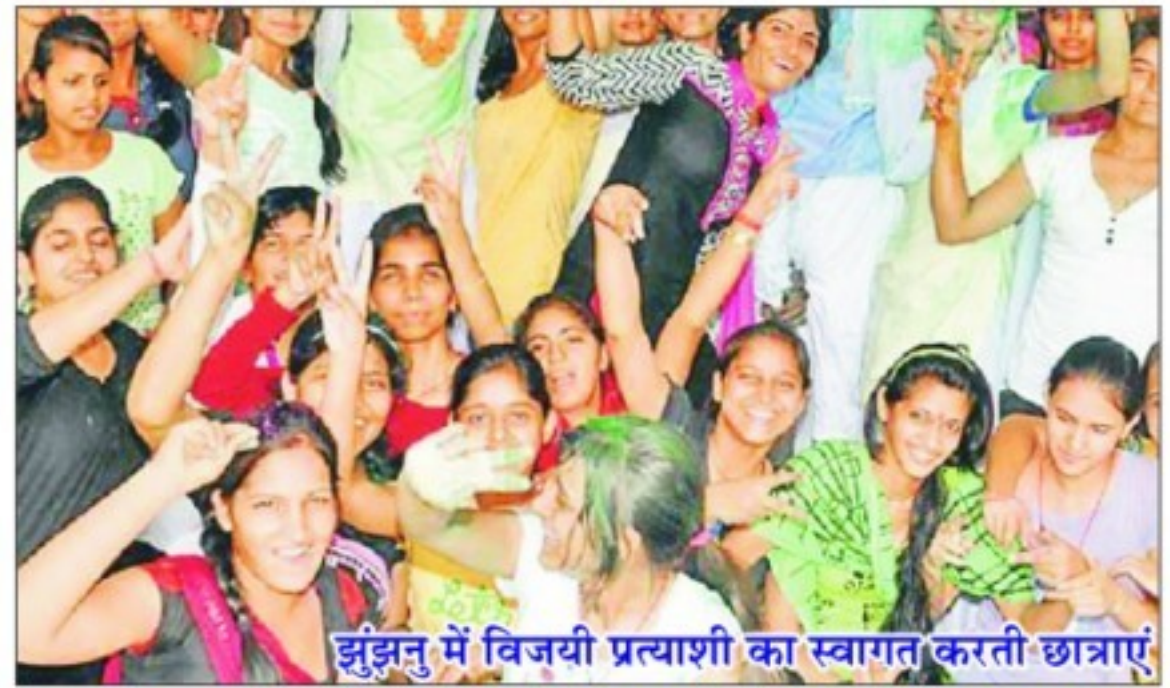
झुंझनु में विजयी प्रत्याशी का स्वागत करती छात्राएं