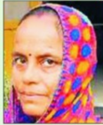
पुष्पा सैनी नगर पालिका उदयपुर वाटी