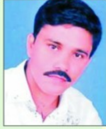
पुष्कर माली नगर पालिका बड़ी सादड़ी