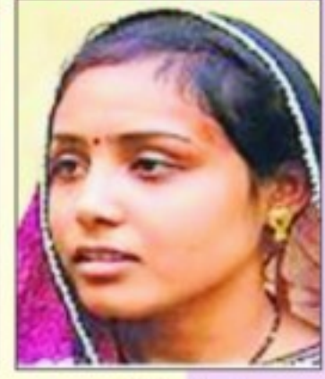
ज्योति सैनी नगर पालिका राजगढ़