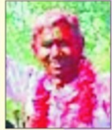
जगदीश माली नगर पालिका लालसोट