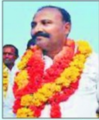
नगर पालिका, अंता रामराज बागड़ी