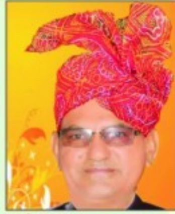
महेन्द्रसिंह कच्छवाह नगर पालिका पीपाड़