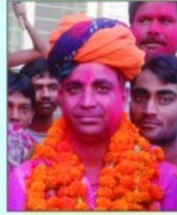
कृपाराम सोलंकी नगर पालिका नागौर