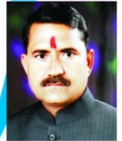
जगदीश देवड़ा प्रेस फोटोग्राफर

डिजीटल फोटो एच डी वीडियोग्राफी अर्जेंट फोटो एवं सभी प्रकार के उत्सवों एवं मांगलिक कार्यक्रमों में फोटोग्राफी