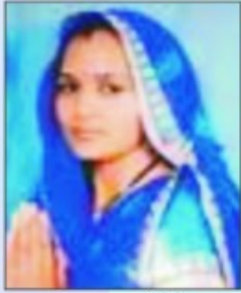
रेणुका सैनी नगर पालिका विराटनगर