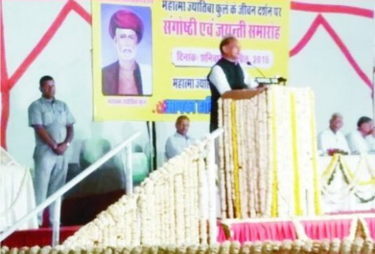
जयपुर में आयोजित महात्मा ज्योति बा फूले जयंती