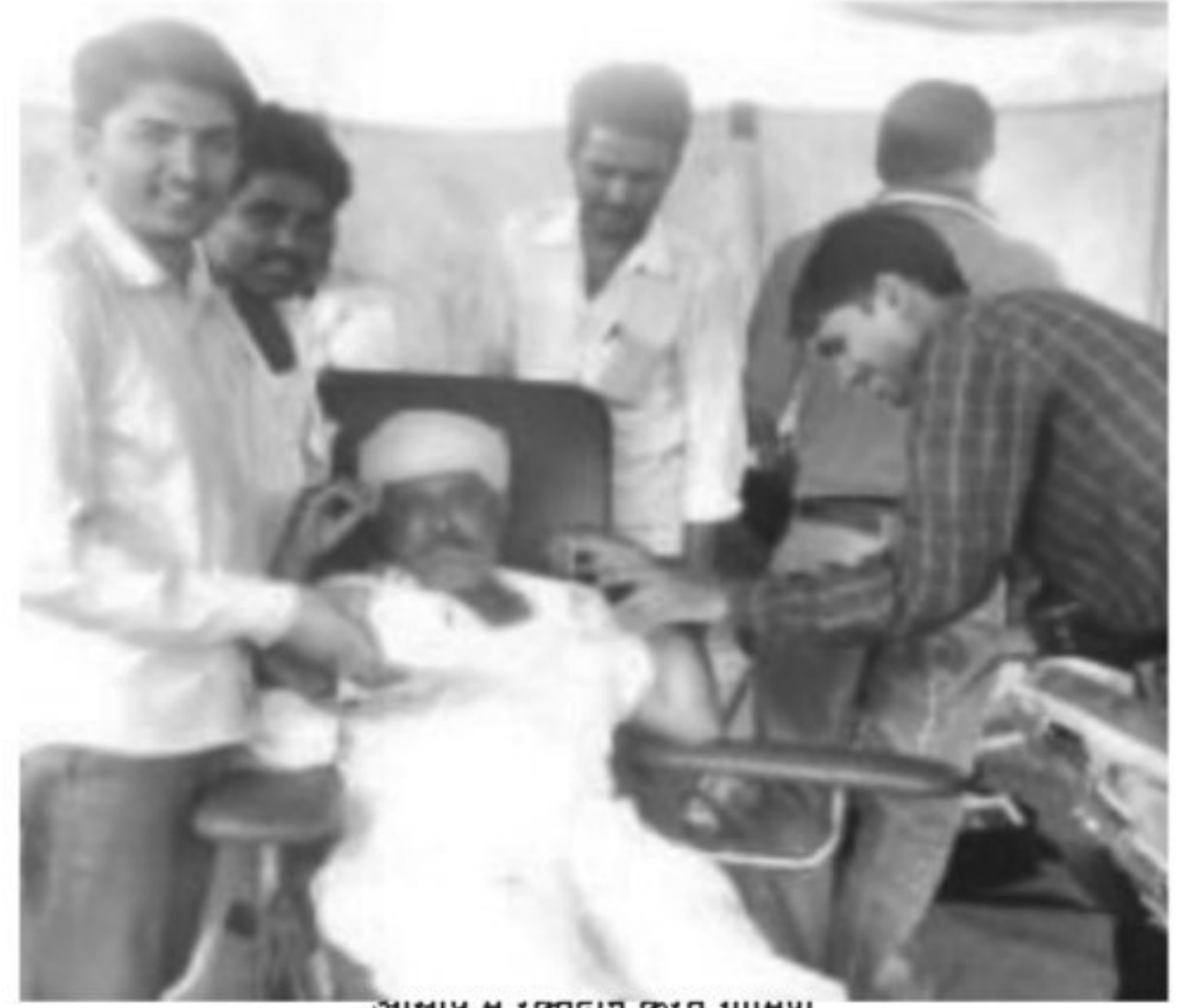
आस्था म रक्तदान करत ग्रामणी