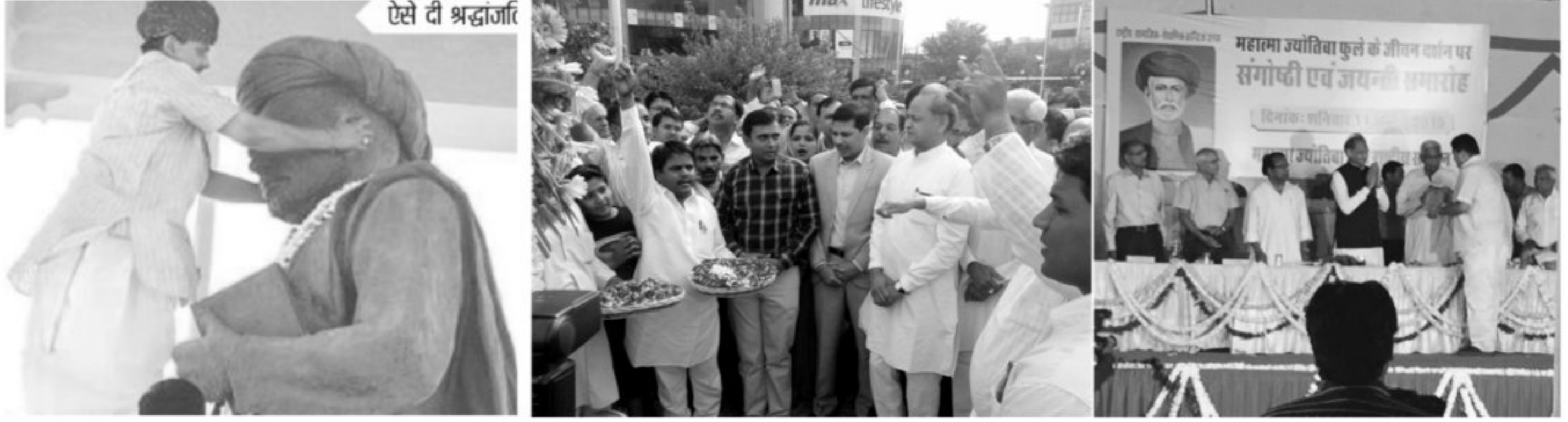
ऐसे दी श्रद्धांजलि

एक साल में 3 करोड़ रूपए खर्च कर तैयार हो जाएगी मुहाना में फूल मंडी, साथ ही शुरू की श्रमिक कल्याण योजना