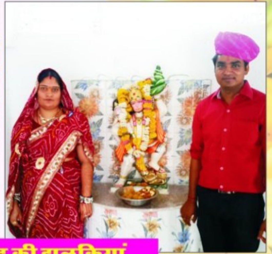
पुष्कर में आयोजित समारोह की झलकियां