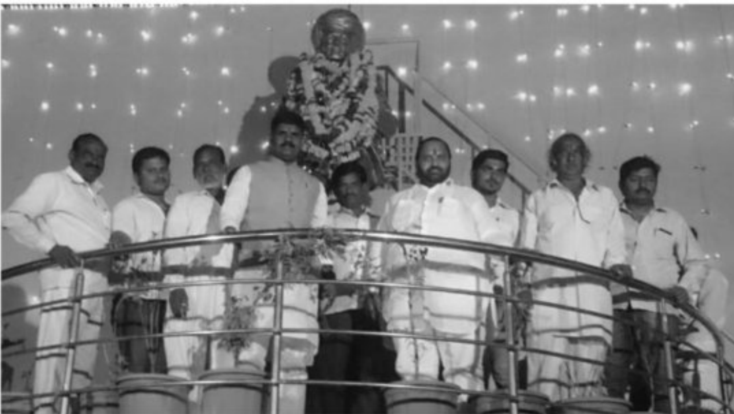
पुना में महात्मा ज्योति बा फूले की प्रतिमा पर पुष्पाजंलि अर्पित करते समाजबंधु