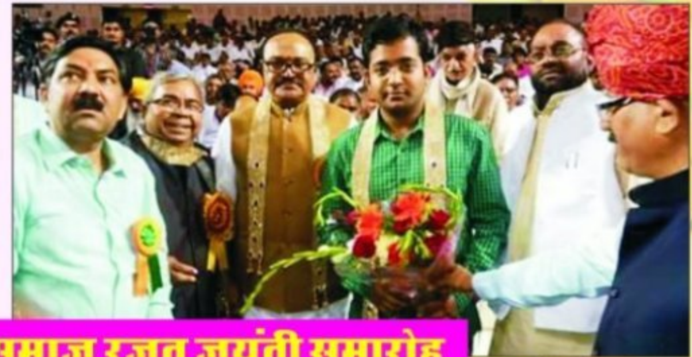
ऑल इण्डिया सैनी समाज रजत जयंती समारोह