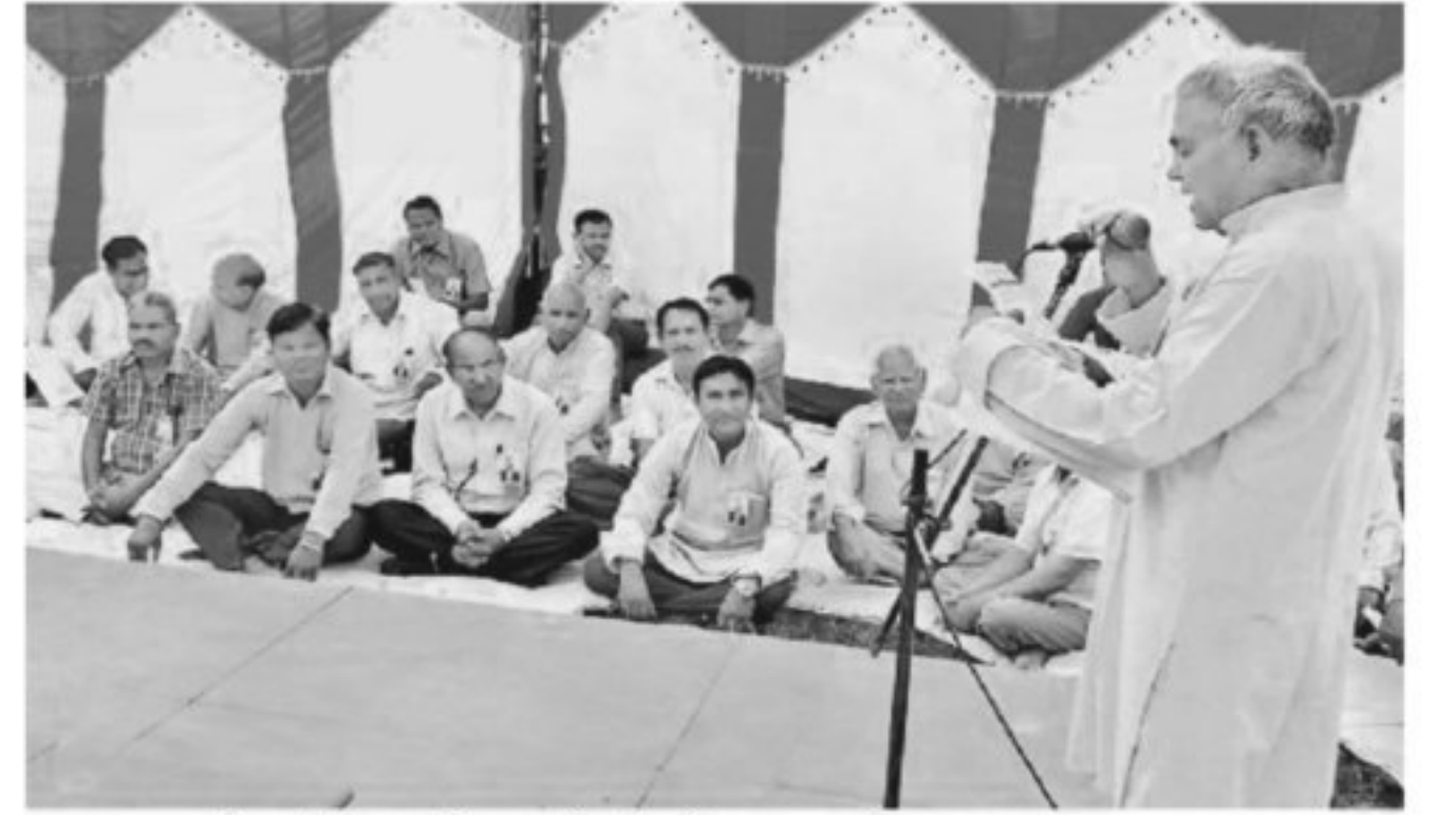
अलवर. फुले जयंती पर विचार गोष्ठी में बात रखते वक्ता।