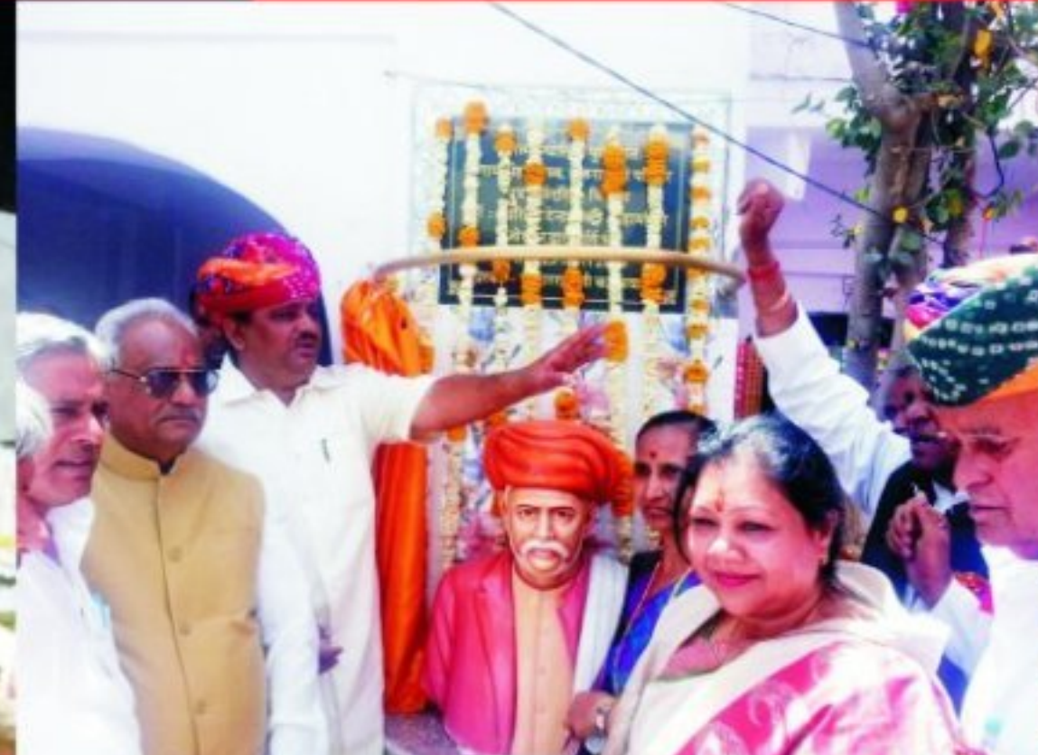
पुष्कर में महात्मा ज्योति बा फूले मूर्ति का अनावरण