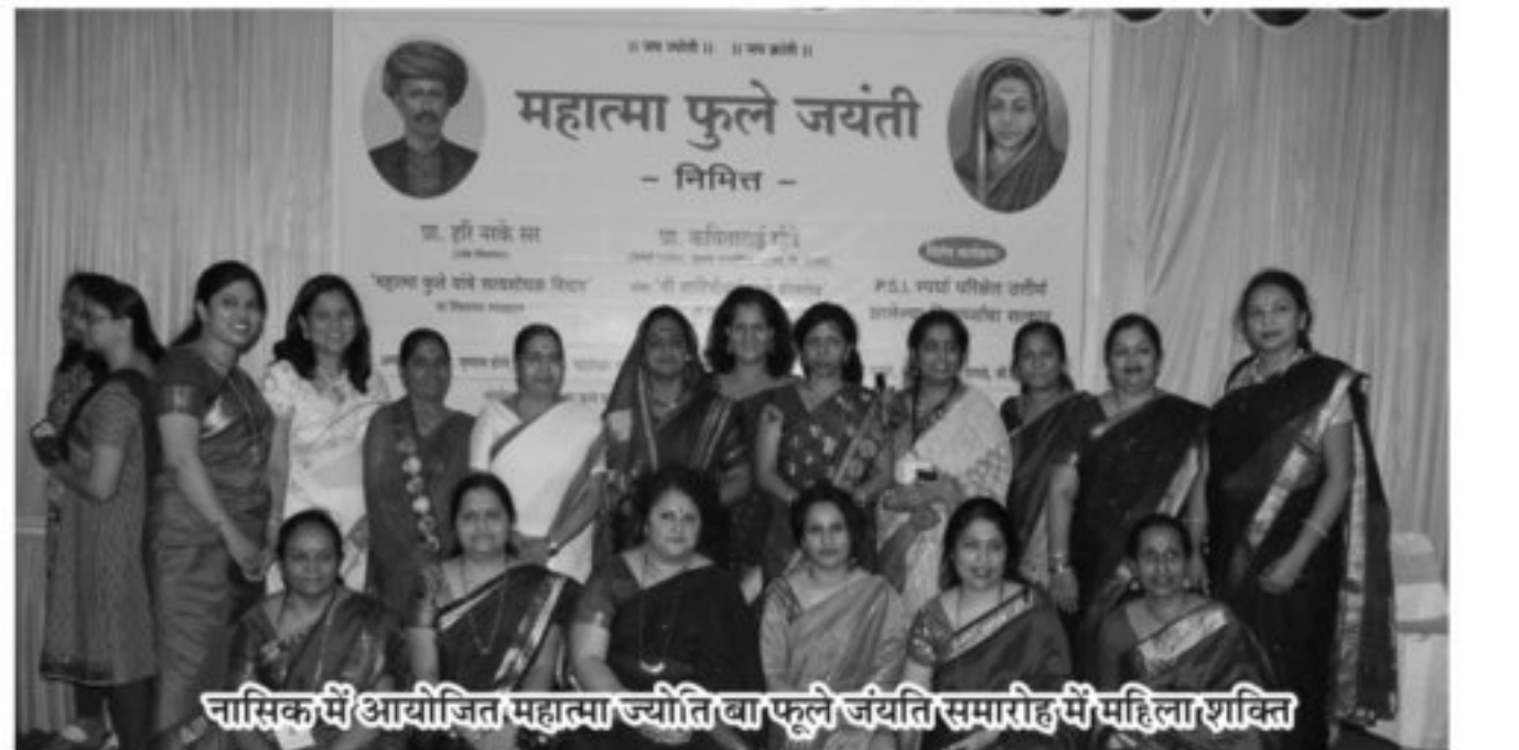
नासिक में आयोजित महात्मा ज्योति बा फूले जयंती समारोह में महिला शक्ति