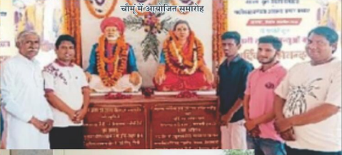
चोम में आयोजित समारोह