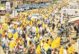
साकर में आयोजित समारोह