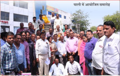
पाली में आयोजित समारोह