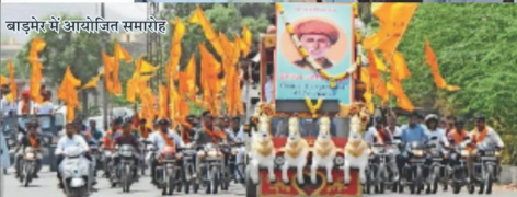
बाड़मेर में आयोजित समारोह