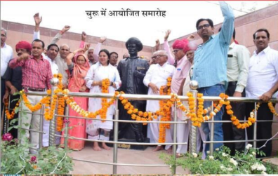
चुरू में आयोजित समारोह