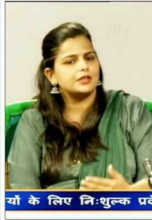
यो के लिए निःशुल्क प्रवे

महिलाएं जो परिवार का समाज का आधार हैं लेकिन महिला संशक्तिकरण के इस दौर में भी इनमे स्वयं के स्वास्थ्य को लेकर जागरूकता का अभाव है। वर्तमान समय में जिस प्रकार बीमारियां बढ़ रही हैं उसके लिए जागरूकता बेहद जरूरी है। उन्होंने बताया कि मेरी कोशिश रहेगी की मैं समय पर जरूरतमंद को मदद पहुँचा सकूँ व स्वास्थ्य क्षेत्र में बेहतर कर सकूँ।