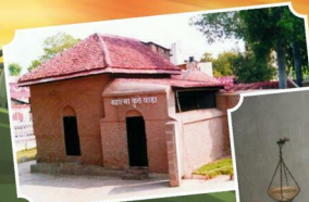
क्रांति ज्योति माता सावित्री बाई फूले स्मृति भवन, पूणे