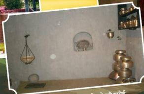
क्रांति ज्योति माता सावित्री बाई फूले की रसोई