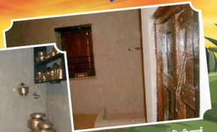
क्रांति ज्योति माता सावित्री बाई फूले जन्म स्थल