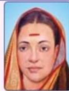
साथिनी बाई फूले