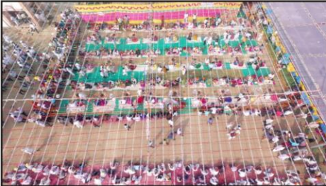
सामूहिक पाणिग्रहण संस्कार चवरी का द्रोण से लिया विहंगम दृश्य