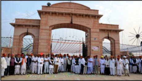
बारातों का स्वागत करते हुए प्रबुद्ध समाज बंधु