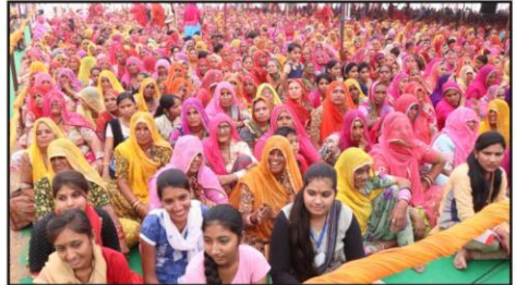
कथा का श्रवण करती मातृ शक्ति