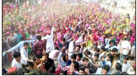
कलश यात्रा में उमड़ी भीड़