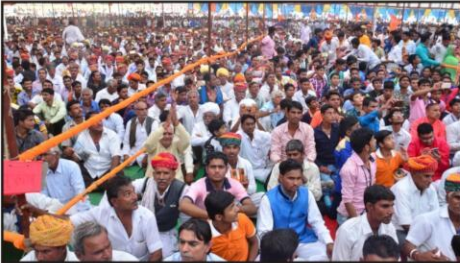
समारोह में उमड़ी भीड़