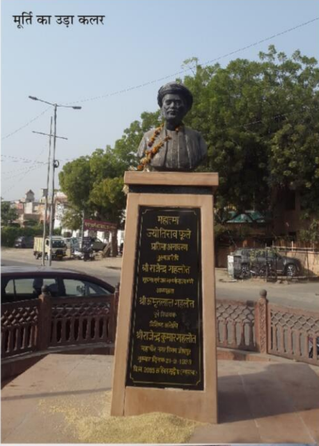
मूर्ति का उड़ा कलर