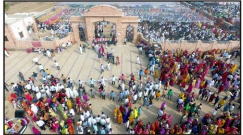
दोड़ से लिया गया विहंगम दृश्य