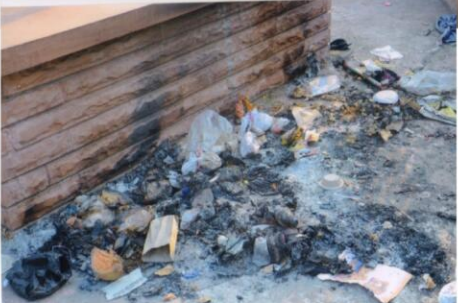
महात्मा फूले की मूर्ति के पास पड़ा कचरा

माली सैनी संदेश परिवार समाज के प्रबुद्ध वर्ग के सहयोग से यहां शीघ्र ही विकास कार्य करवा टूटी हुई झालियों, टाईल्स एवं महात्मा की प्रतिमा का रंग रौगन करवा गार्डन का मूल स्वरूप लौटाने का कार्य आरंभ करेगी साथ ही यहां की लाईटों को चालू करवा आगामी 28 नवंबर, 2017 को महात्मा ज्योति बा फूले की 127 वीं पुण्यतिथि से पूर्व इसका मूल स्वरूप लोटा सामाजिक क्रांति के अग्रदूत महात्मा ज्योति बा फूले को श्रद्धांजलि अर्पित करेगे।