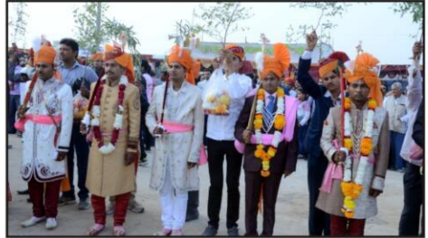
सामूहिक विवाह में वर अपने परिजनों के साथ