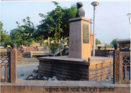
महात्मा फूले पार्क को टूटी झालियां