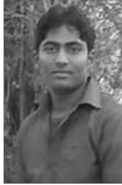
माली समाज गौरव