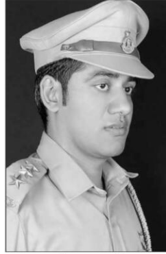
माली समाज गौरव