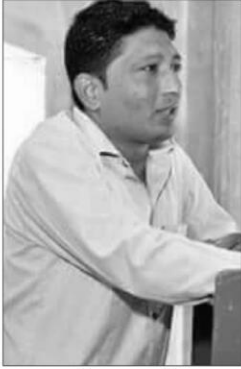
माली समाज गौरव