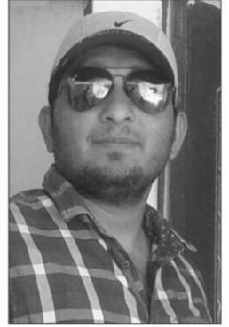
माली समाज गौरव