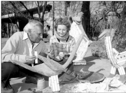
टुकड़े, टाइल्स, मार्बल्स और ऐसे ही न जाने कितने

कबाड़ा यह सब साइकिल से ढोकर रोज जंगल में ले जाते। वहां झील किनारे के एक हिस्से को मैदान सा बना लिया था। वहीं अपने सपनों के गांव को रचने में जुटे रहे।