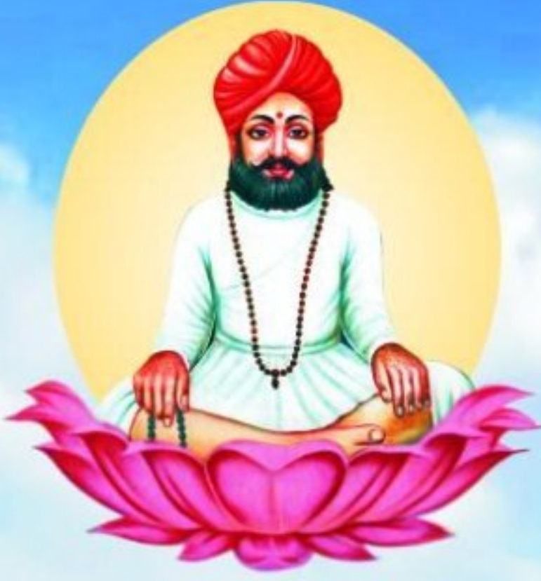
संत शिरोमणी लिखमीदास जी महाराज