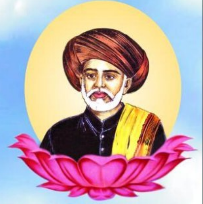
महात्मा ज्योति बा फूले