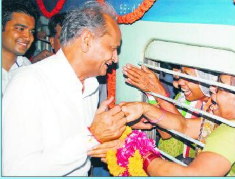
राज्य सरकार द्वारा बुर्जगों के लिए धार्मिक यात्रा के लिए पहली गाड़ी में रवाना होने वाली बुर्जग माताएं श्री अशोक गहलोत को आशीर्वाद प्रदान करते हुए।