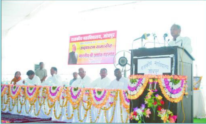
राजकीय महाविद्यालय, चैनपुरा, जोधपुर के प्रथम शैक्षणिक सत्र का उद्घाटन करते श्री अशोक गहलोत एवं उपस्थित जनसमूह