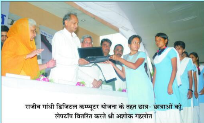
राजीव गांधी डिजिटल कम्प्यूटर योजना के तहत छात्र-छात्राओं को लेपटॉप वितरित करते श्री अशोक गहलोत